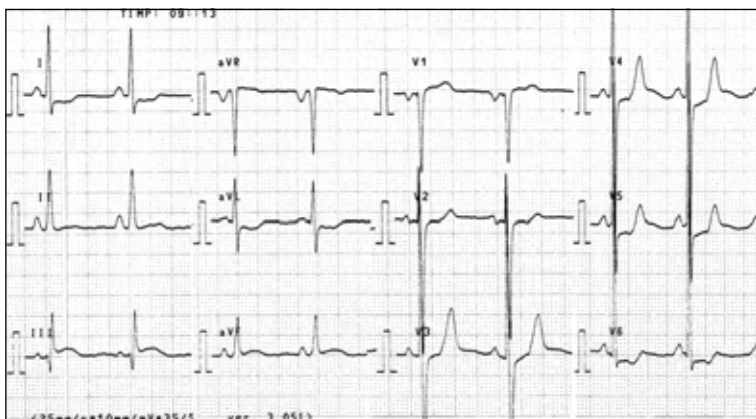
Figura 1 Electrocardiograma după tratament: ritm sinusual, AV = 75/min, ax QRS = +75°, hipertrofie atrială dreaptă, hipertrofie biventriculară

Diagnosticul se bazează pe ecocardiografia bidimensională, rezonanța magnetică, ECG, radiografia toracică. Studiile de genetică moleculară au oferit importante clarificări privind heterogenitatea clinică și genetică a CMPH incluzând posibilitatea diagnosticului preclinic al indivizilor afectați de o genă mutantă, dar